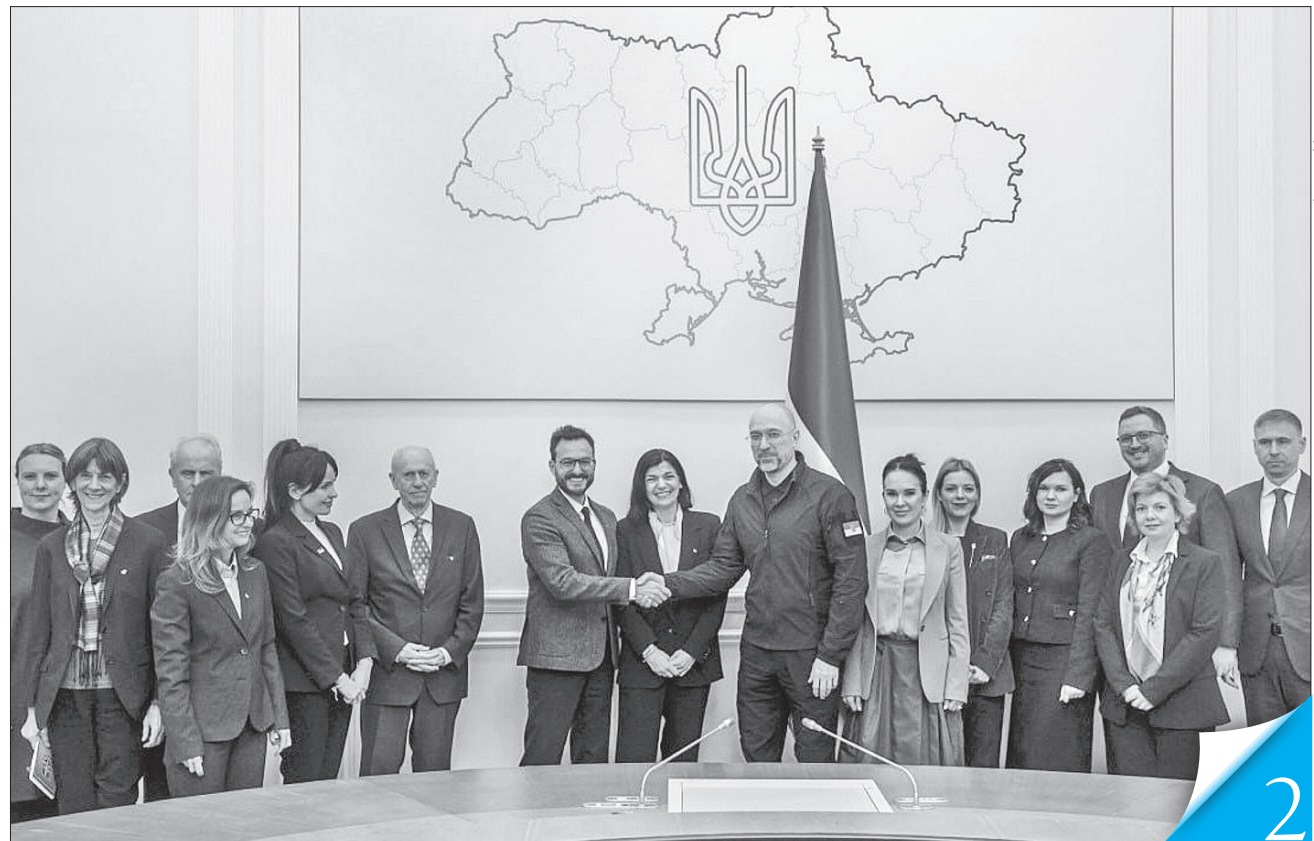
Денис Шмигаль і представники Міжнародного реєстру обговорили подальші етапи у спільній роботі

СПРАВЕДЛИВІСТЬ. За словами Прем'єра, відучора українці можуть подавати до Реєстру збитків заяви за шістьма новими категоріями