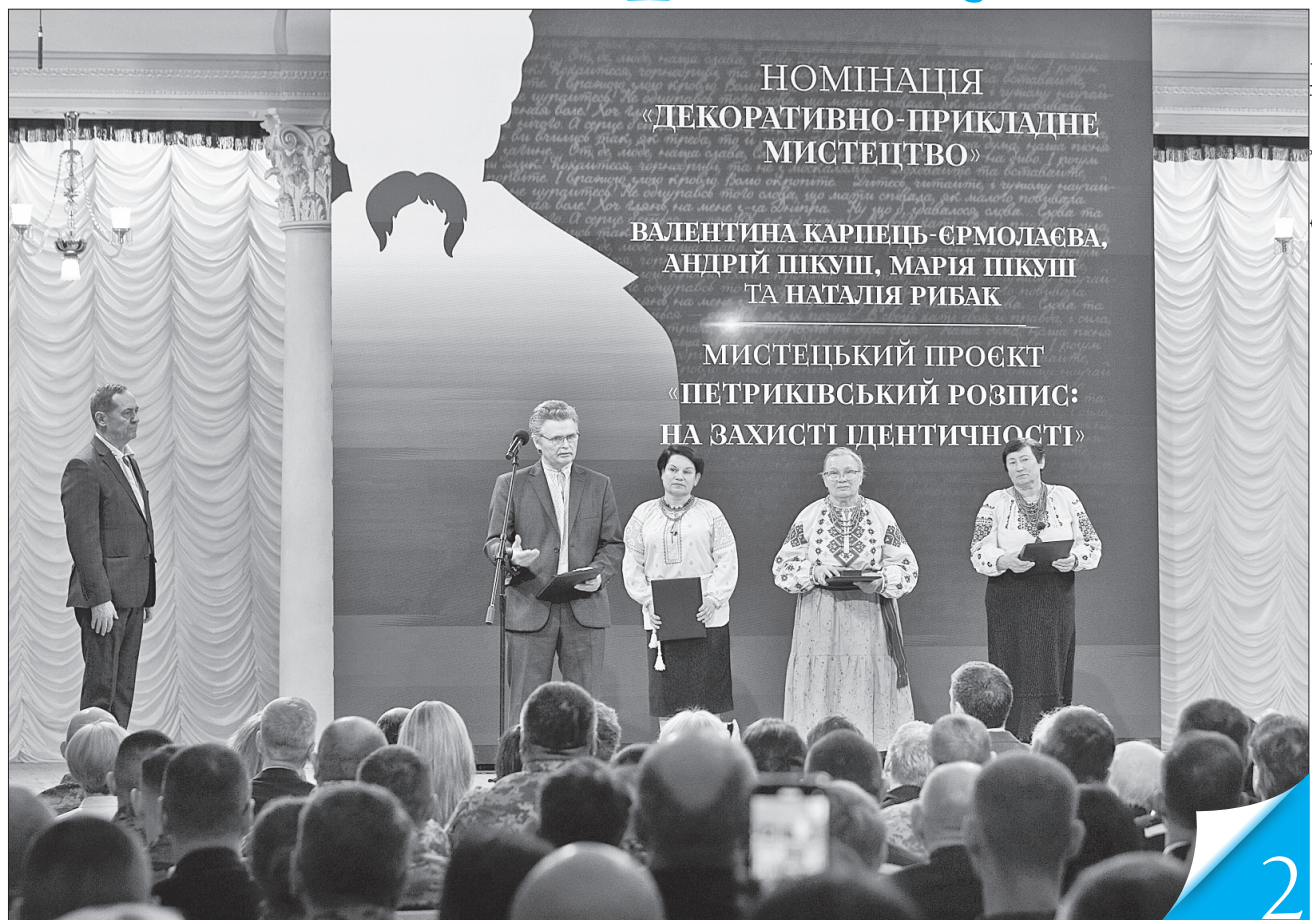
Майстри петриківського розпису отримали нагороду за свій мистецький проєкт, спрямований на відродження та творчий розвиток автентичних традицій

ВИЗНАННЯ. У день народження Кобзаря в Києві відбулася церемонія нагородження лауреатів Національної премії імені Тараса Шевченка 2025 року