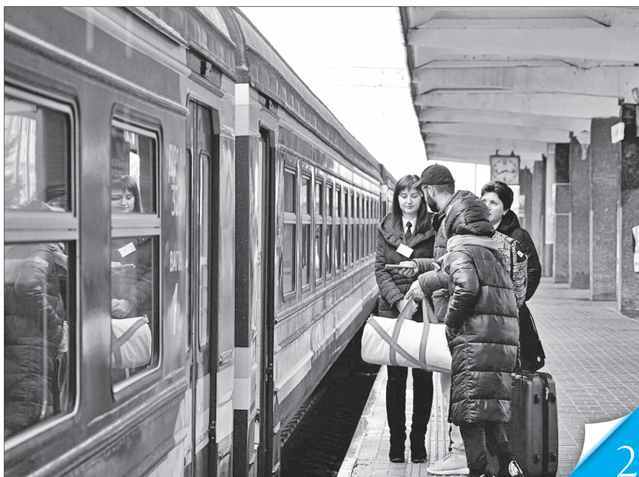
Використати кошти громадяни можуть до кінця 2025 року, зокрема й на придбання залізничних квитків

ПЕРЕЗИМУВАЛИ. 14,4 мільйона українців скористалися можливістю одержати 1000 гривень завдяки програмі «Зимова єПідтримка»