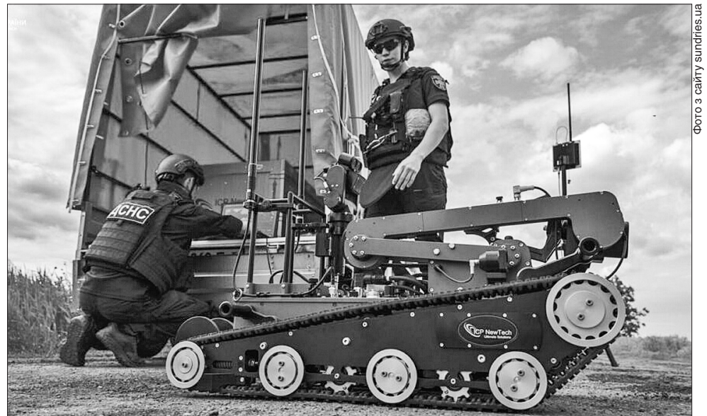
Успішне завершення проекту — це внесок у збереження життя військових і цивільних, які живуть на деокупованих територіях або поблизу лінії фронту

«Україна сьогодні найбільш потенційно замінована країна світу — 20% нашої території потребують обстеження. Щоб у деокуповані й прикордонні регіони поверталися люди, а бізнес відновлював роботу й аграрії могли засівати поля, держава, приватні оператори і благодійники активно працюють над розмінуванням території. Якщо ще два роки тому в Україні не було жодної машини для розмінування, нині їх уже понад 200, і ці цифри зростають. І як наслідок зростає територія, яку вдалося очистити від вибухонебезпечних предметів. Я щиро вдячна