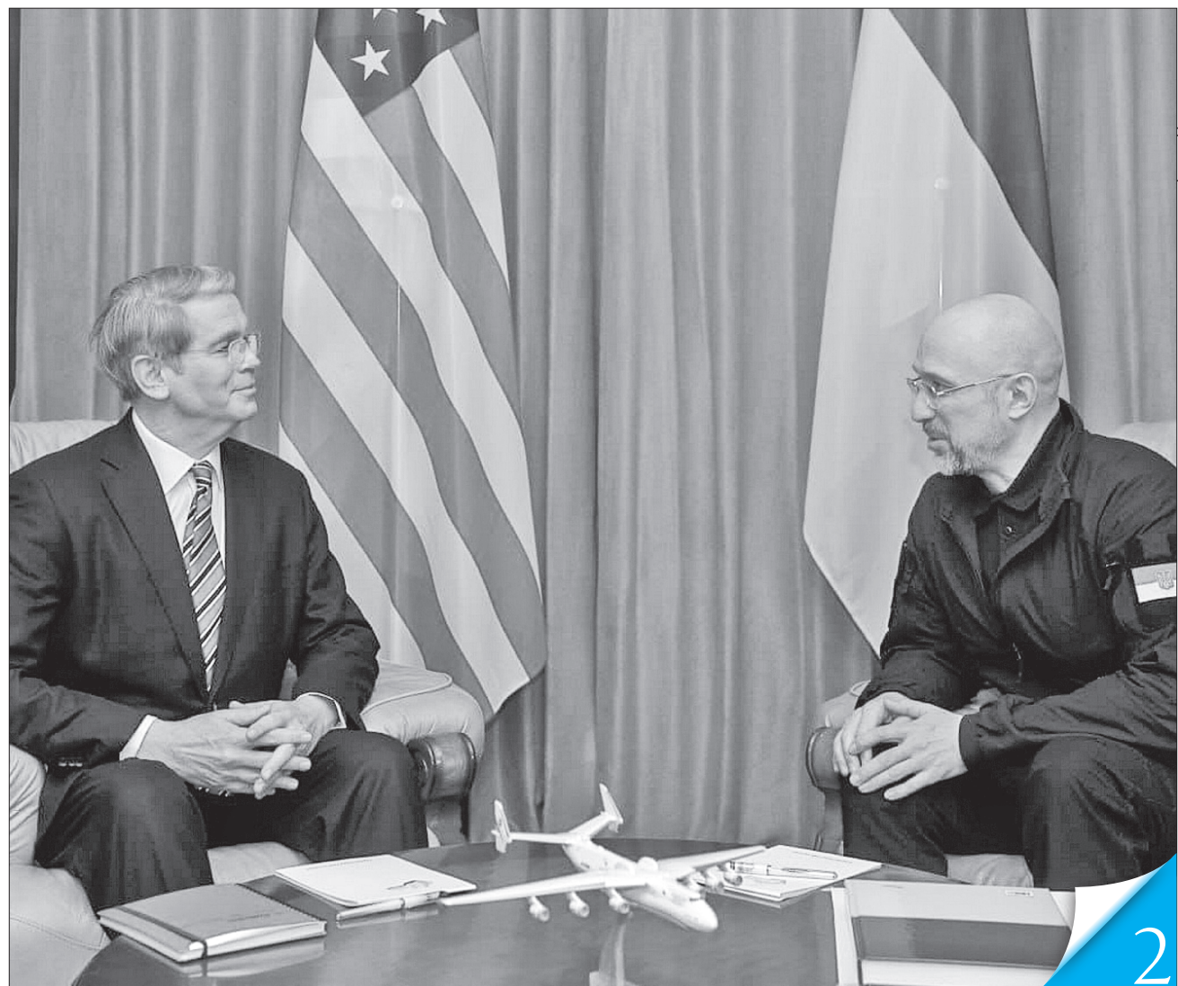
Денис Шмигаль і Скотт Бессент обговорили економічну співпрацю та посилення санкційної політики проти рф

ВАЖЛИВИЙ СИГНАЛ. Україна і США готують угоду, яка зміцнить нашу безпеку й дасть новий поштовх економічній співпраці між двома країнами