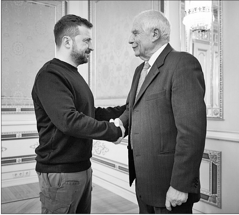
Володимир Зеленський подякував Жозепу Боррелю за його особисту присутність в Україні у найважчі дні війни

Прем'єр-міністр Денис Шмигаль під час зустрічі з високим представником Європейського Союзу із закордонних справ та безпекової політики Жозепом Боррелем подякував за по-