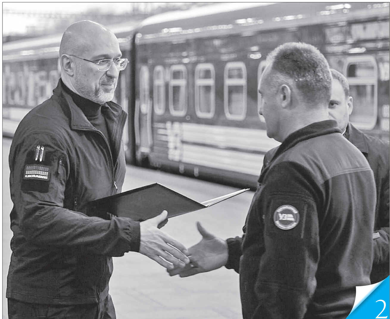
Денис Шмигаль вручив почесні грамоти Кабінету Міністрів України та подяки Прем'єр-міністра

НАШІ — НАЙКРАЩІ. Президент і Прем'єр привітали українських залізничників із професійним святом