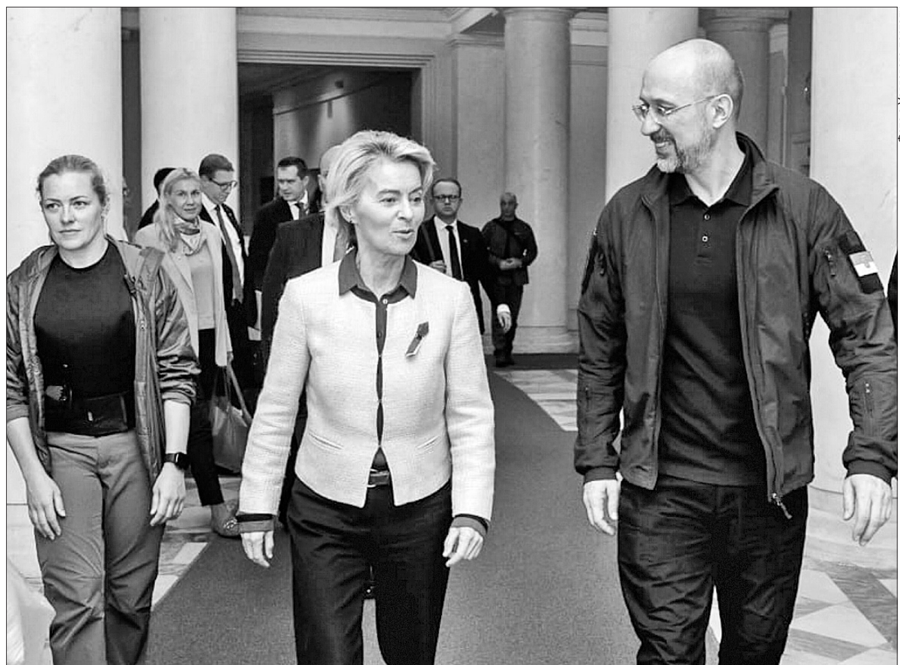
Прем'єр-міністр Денис Шмигаль висловив подяку Урсулі фон дер Ляен та Європейській комісії за започаткування нової програми макрофінансової підтримки