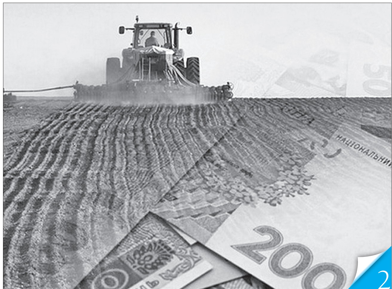
Конкурентна та відкрита оренда земель дасть змогу наповнювати бюджети

АГРОПЕРСПЕКТИВА. Фонд державного майна презентував проект, який трансформує ринок державних сільгоспземель