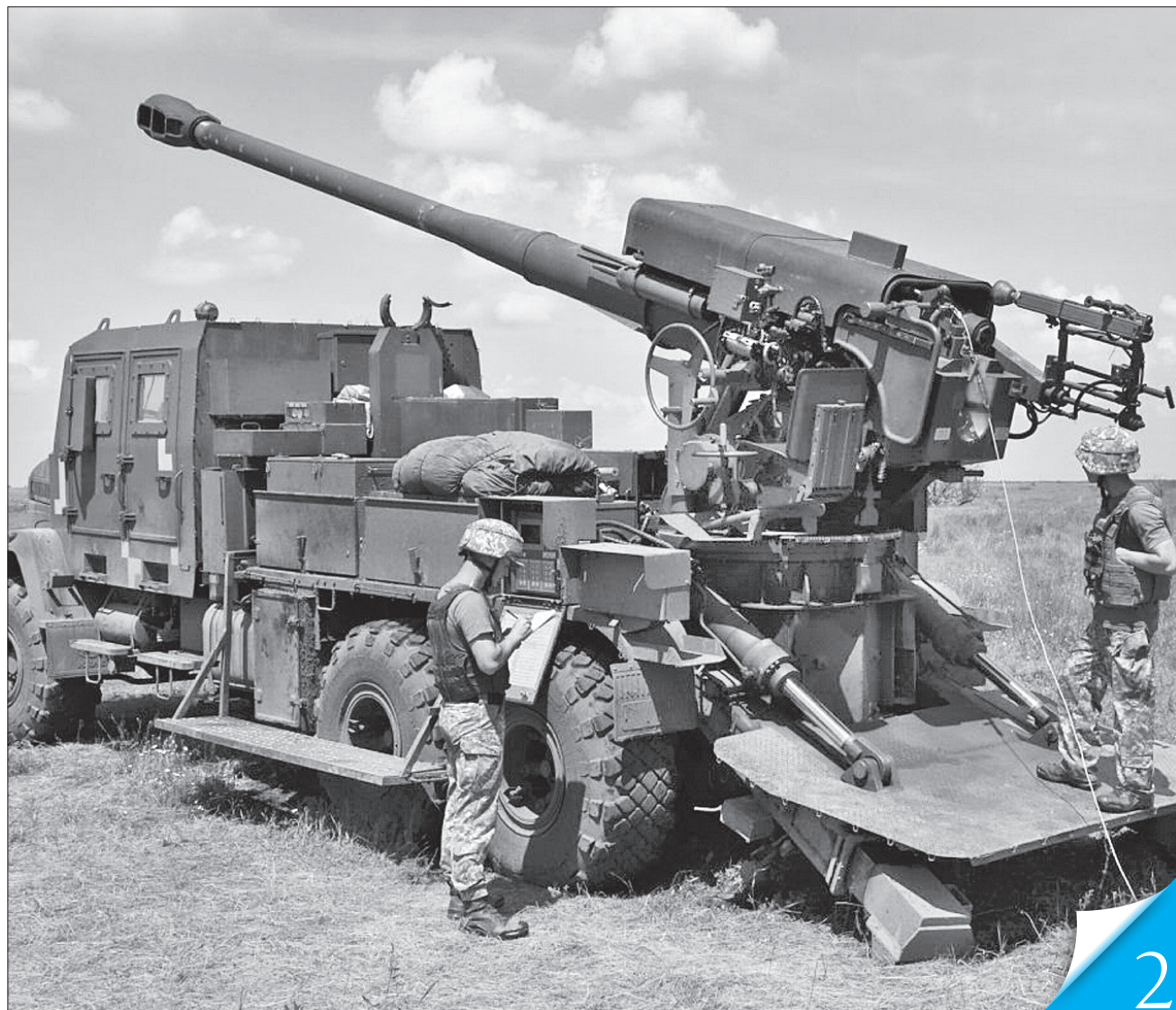
Витрати на придбання озброєння, військової техніки та підтримку ОПК в головному кошторисі країни зростуть

ФІНАНСИ. Кабінет Міністрів схвалив проект Держбюджету на 2025 рік та передав його на розгляд Верховної Ради