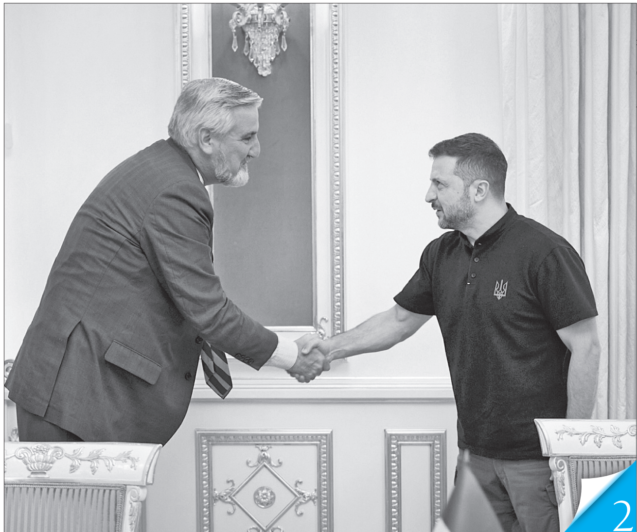
Володимир Зеленський подякував Еріку Холкомбу за підтримку України та зацікавленість у співпраці на рівні регіонів

ПАТРОНАТ. Житомирська область та американський штат Індіана підписали меморандум про співпрацю