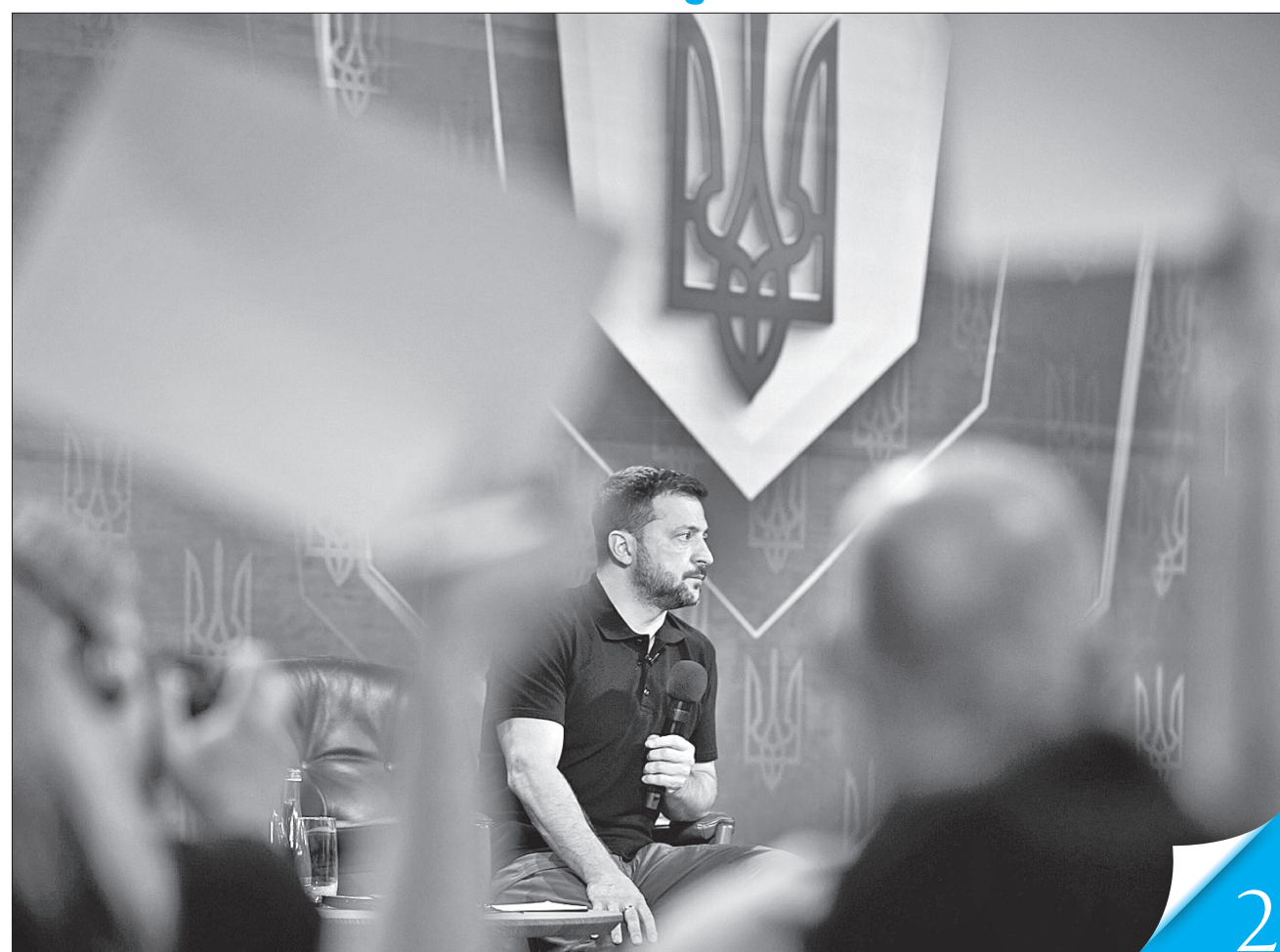
Президент Володимир Зеленський заявив, що операція в Курській області — один з пунктів плану перемоги України у війні

З ПЕРШИХ ВУСТ. Під час форуму «Україна 2024. Незалежність», який відбувся вчора в Києві, суспільство отримало відповіді на актуальні запитання