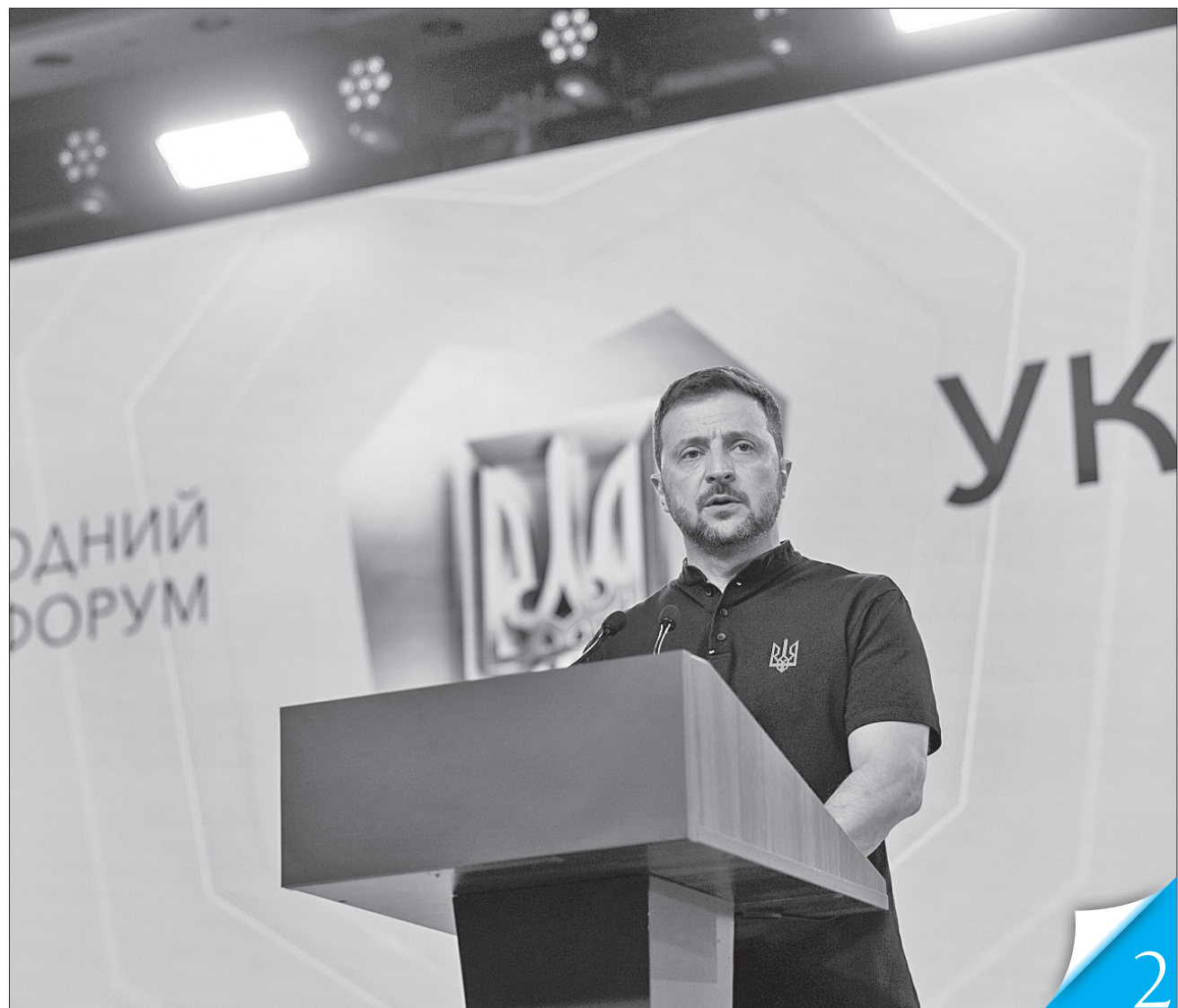
Президент Володимир Зеленський наголосив, що все має бути організовано так, щоб ветерани в нашій країні були цілковито інтегровані в суспільне життя

СПІЛЬНОДІЯ. У Києві відбувся VII Міжнародний ветеранський форум «Україна. Ветерани. Єдність»