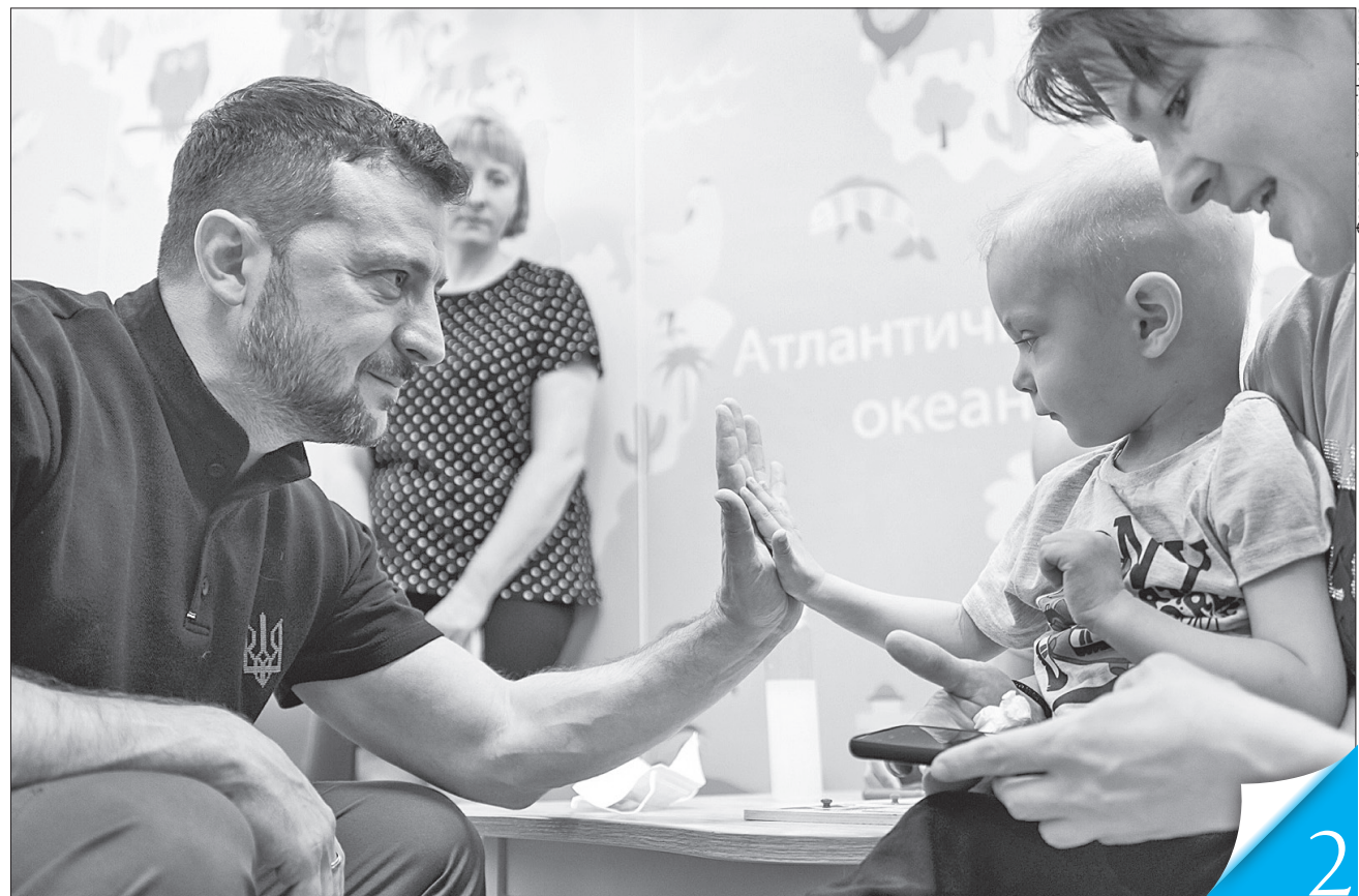
«Тримай п'ять!», — Володимир Зеленський поспілкувався з дітьми, які лікуються в онкологічному відділенні Охматдиту

Володимир Зеленський та головнокомандувач ЗСУ Олександр Сирський заслухали доповідь командувача Сил спеціальних операцій Олександра Трепака про стратегію розвитку ССО та виконані й заплановані завдання. Він розповів про три основні напрями діяльності ССО: психологічні операції та некінетичні дії, рух опору на тимчасово окупованих територіях і дії підрозділів спецпризначення, повідомляє Офіс Президента.