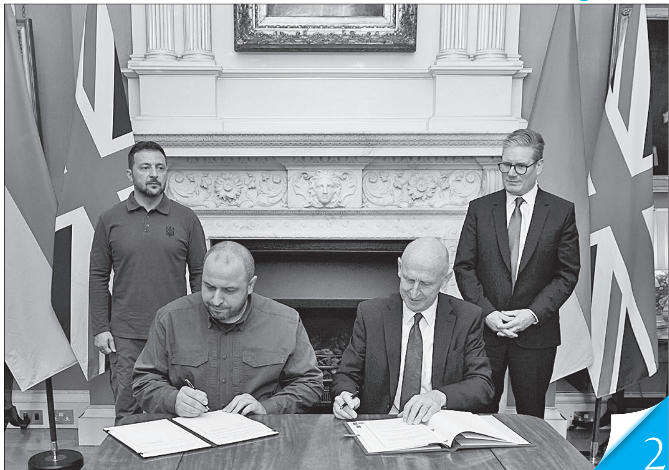
У присутності Володимира Зеленського і Кіра Стармера міністри оборони Рустем Умеров і Джон Гілі підписали угоду щодо офіційної кредитної підтримки в розвитку оборонних спроможностей України