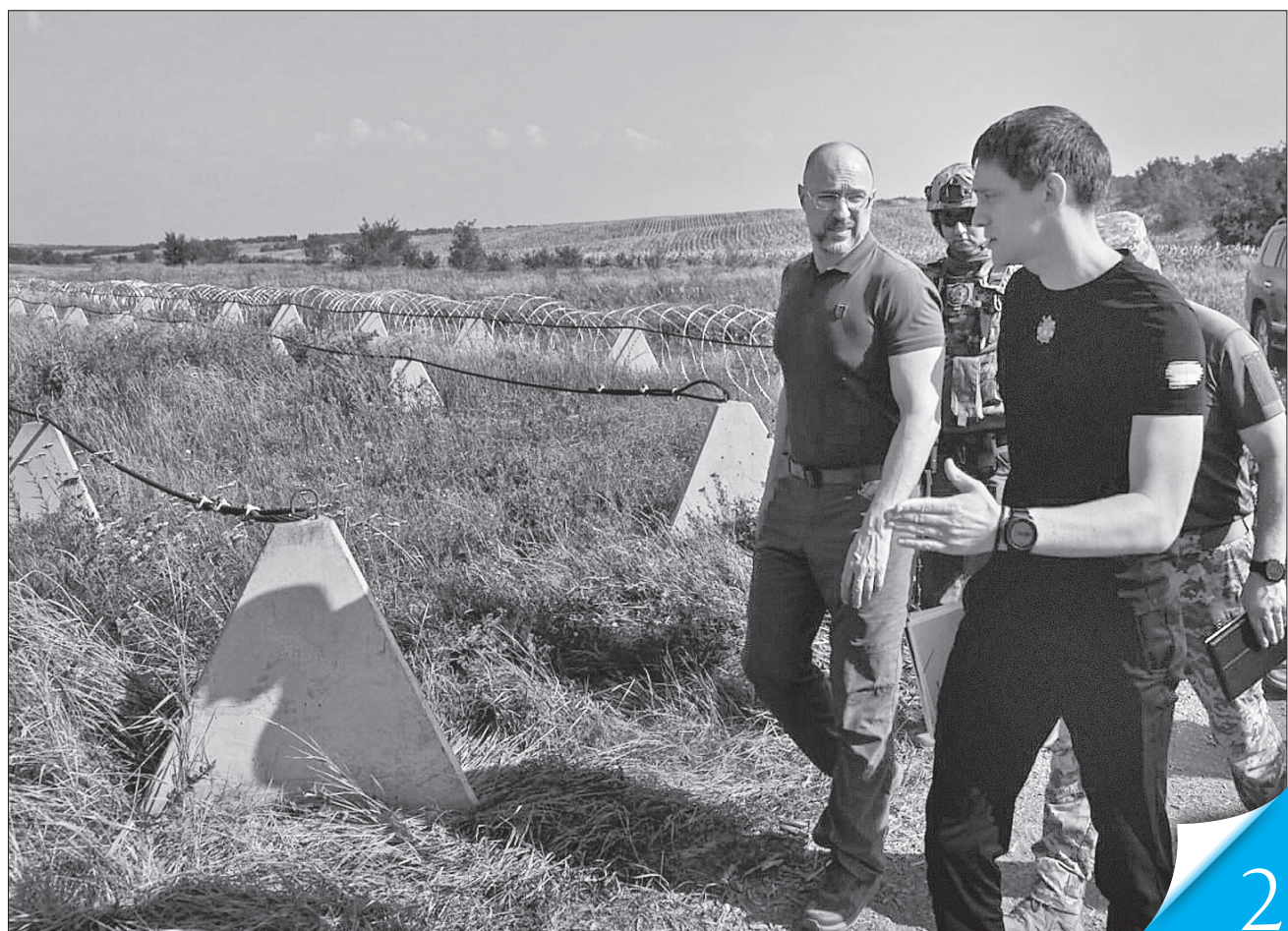
На Запоріжжі Денис Шмигаль ознайомився з будівництвом фортифікаційних споруд

ЗАСІДАННЯ КАБІНЕТУ МІНІСТРІВ. Прем'єр-міністр наголосив, що уряд постійно реагує на запити місцевої влади та підтримує важливі ініціативи