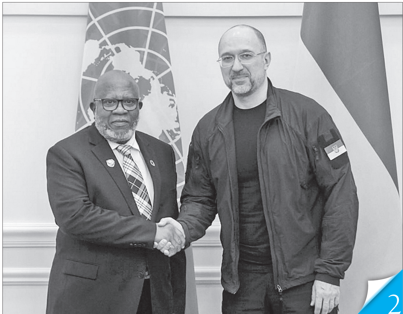
Прем'єр-міністр Денис Шмигаль обговорив з Деннісом Френсісом потреби України в обладнанні для відновлення та розбудови децентралізованої енергосистеми

ГЛОБАЛЬНА ПІДТРИМКА. Голова Генасамблеї ООН мав змогу побачити на власні очі наслідки війни та зрозуміти виклики, які стоять перед українським народом