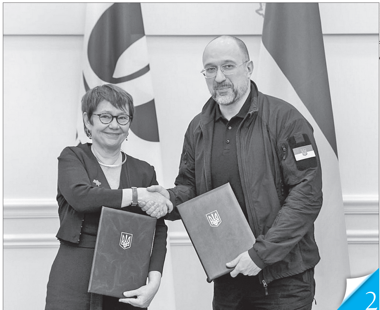
Прем'єр-міністр Денис Шмигаль та президент Європейського банку реконструкції та розвитку Оділь Рено-Бассо підписали документ про взаєморозуміння

МЕМОРАНДУМ. ЄБРР акумулює 300 мільйонів євро на підтримку нашого енергетичного сектору