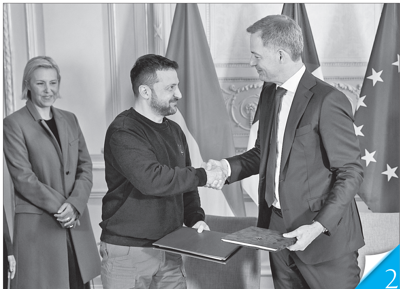
Бельгійський Прем'єр Александр Де Кроо запевнив Володимира Зеленського, що перші літаки буде передано вже цього року

ДОКУМЕНТ. Україна та Бельгія підписали двосторонню безпекову угоду, в якій чітко зафіксовано постачання 30 літаків F-16 до 2028 року