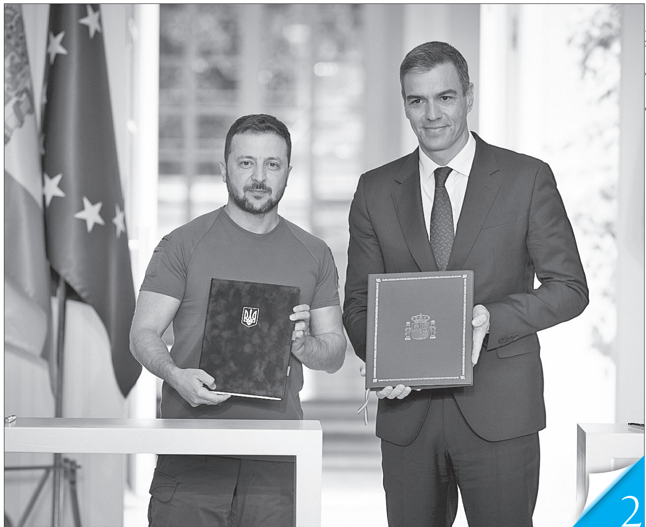
Угоду підписали Президент України Володимир Зеленський і Прем'єр-міністр Іспанії Педро Санчес

ВСЕБІЧНА ПІДТРИМКА. Іспанія стала десятою країною, з якою Україна уклала двосторонню безпекову угоду