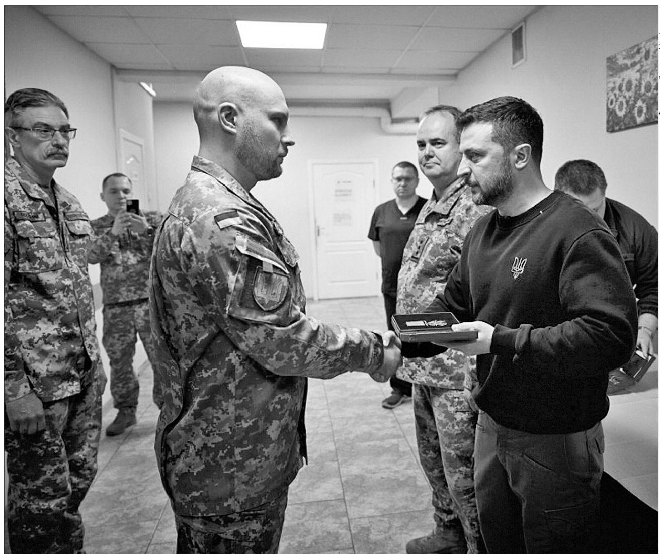
Володимир Зеленський нагородив оборонців Харківщини і військових медиків

БОЙОВА СИТУАЦІЯ. Президент України провів у Харкові засідання Ставки Верховного Головнокомандувача