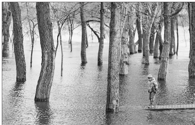
Підвищення рівня води в Києві у квітні спричинено її скидом через турбіни Київської ГЕС