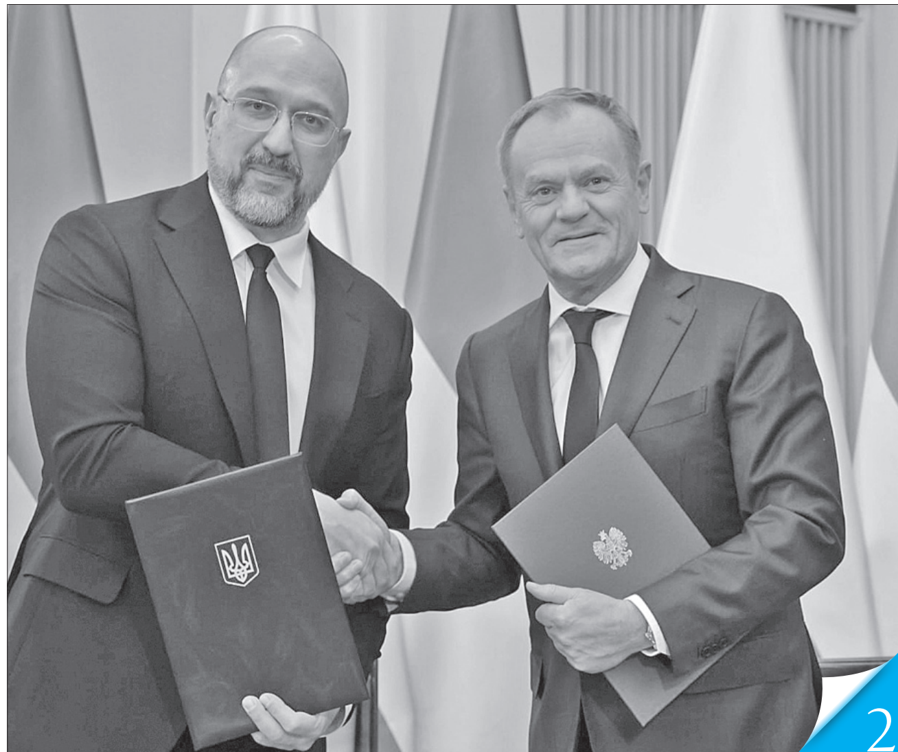
У спільній заяві прем'єри Денис Шмигаль і Дональд Туск окреслили поточні двосторонні відносини та подальші плани

ПРАГМАТИЧНА СПІВПРАЦЯ. У Варшаві відбулися українсько-польські урядові консультації. Ішлося зокрема про ситуацію на кордоні й торгівлю в аграрному секторі