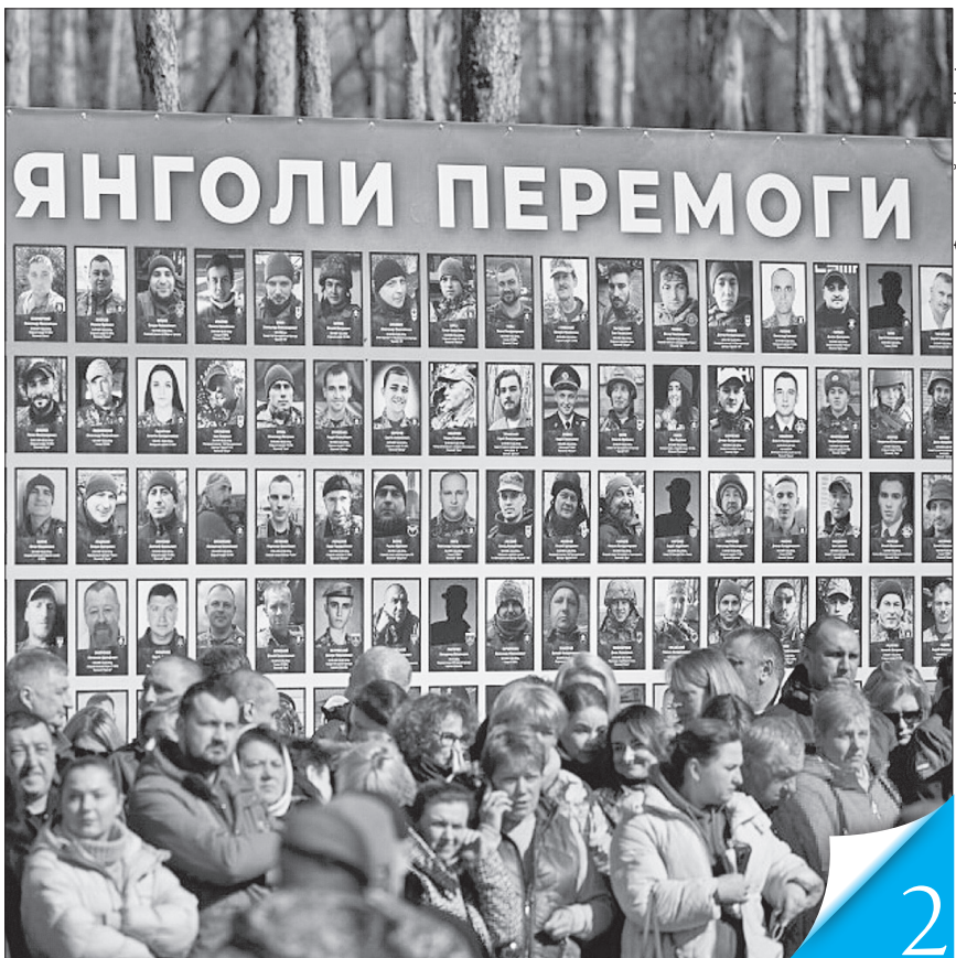
Пам'ять воїнів ушанували в лісі, де відбувалися одні з найзапекліших подій у березні 2022 року

ЯНГОЛИ ПЕРЕМОГИ. У боях за міста й села Київщини було визначено долю України та столиці