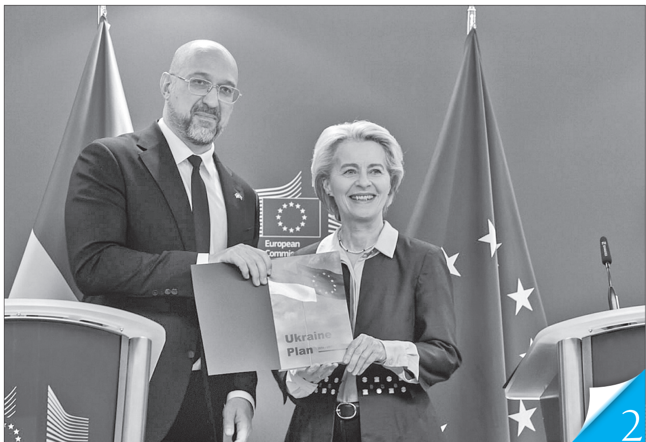
Прем'єр-міністр Денис Шмигаль передав президентці Єврокомісії Урсулі фон дер Ляен затверджений урядом план для реалізації цієї програми

СТРАТЕГІЧНЕ ПАРТНЕРСТВО. Україна отримала 4,5 мільярда євро перехідного фінансування від Євросоюзу в межах програми Ukraine Facility