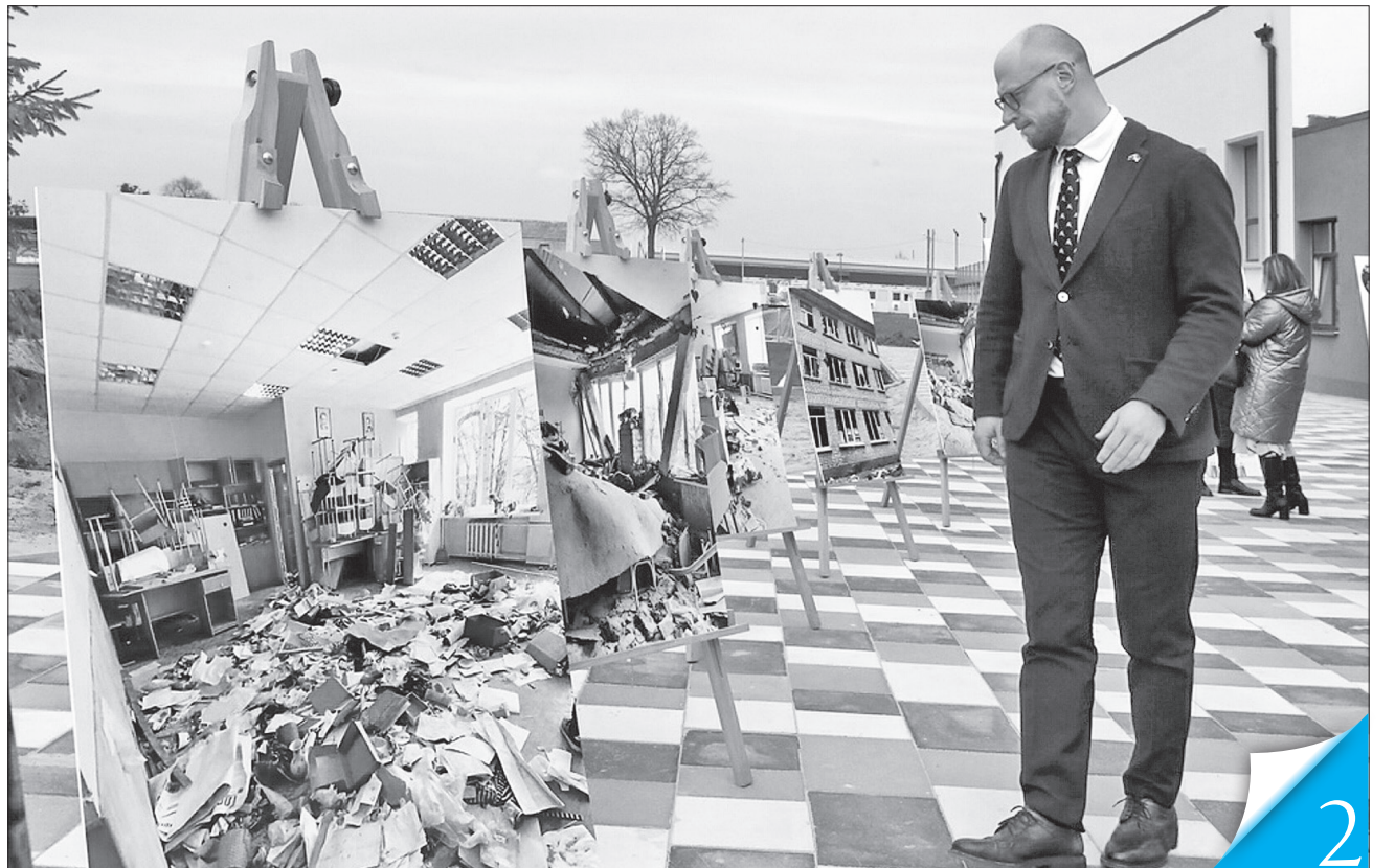
На місці зруйнованої майже вщент будівлі постав Литовсько-український лицей №1

КРАЩЕ, НІЖ БУЛО. Поряд збудовано підземне укриття, прилегле до навчального закладу, що одночасно вміщує майже 800 осіб