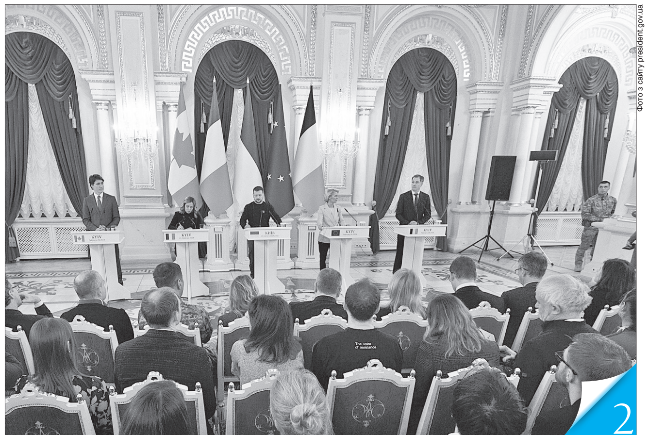
Володимир Зеленський подякував Прем'єр-міністру Канади Джастіну Трюдо, Голові Ради міністрів Італії Джорджі Мелоні, Президентів Єврокомісії Урсулі фон дер Ляен, Прем'єр-міністру Бельгії Александру Де Кроо, а також усім друзям і партнерам України за все, що вони зробили для нас упродовж повномасштабної війни

ЄДНІСТЬ. У другу річницю повномасштабного вторгнення рф у Київ прибули друзі та партнери, щоб продемонструвати непохитну підтримку опору українського народу