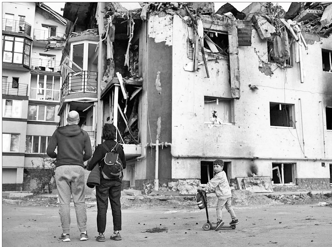
Масштаби зла, заподіяного російськими окупантами, на жаль, зростають, тому уряд удосконалює допомогу громадянам, щоб вони не залишалися з бідною наодинці

ВІДНОВЛЕННЯ. Державна програма компенсацій за пошкоджене та знищене житло розширює функціонал, щоб бути ще більше доступною та зручною в користуванні