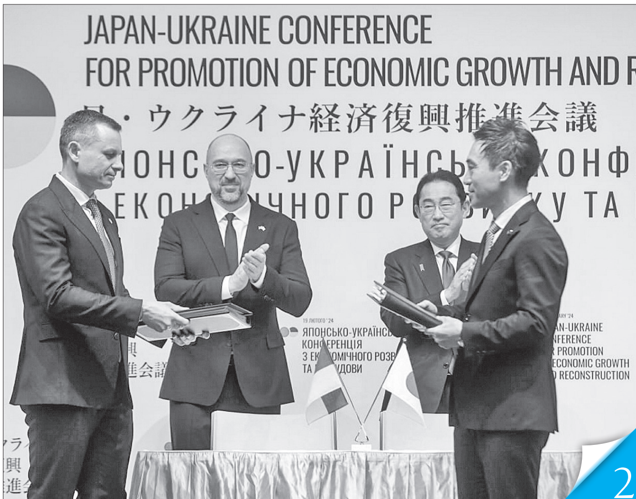
Конвенцію між урядом України та урядом Японії про усунення подвійного оподаткування підписали в присутності прем'єрів міністри фінансів

МІЖНАРОДНА ДІЯЛЬНІСТЬ. Україна та Японія підписали 56 документів на Конференції з економічного розвитку та відбудови в Токіо