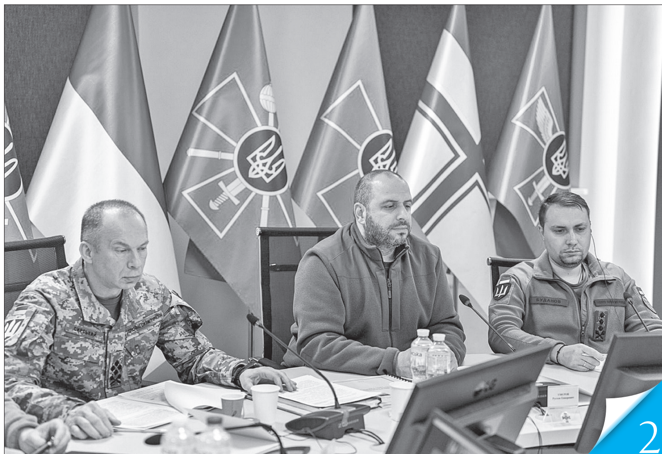
Україну онлайн представляли міністр оборони Рустем Умеров, головнокомандувач Олександр Сирський і начальник ГУР Кирило Буданов

«РАМШТАЙН-19». Участь у засіданні Контактної групи з питань оборони України взяли представники оборонних відомств майже 50 країн-партнерів