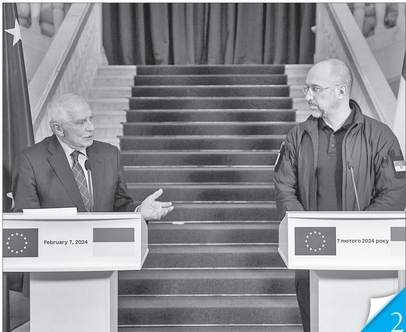
Денис Шмигаль і Жозеп Боррель домовилися провести наступне засідання Ради асоціації Україна — ЄС у березні

ПІДСУМКИ ВІЗИТУ. ЄС надасть 1 мільйон необхідних Україні боєприпасів до кінця цього року