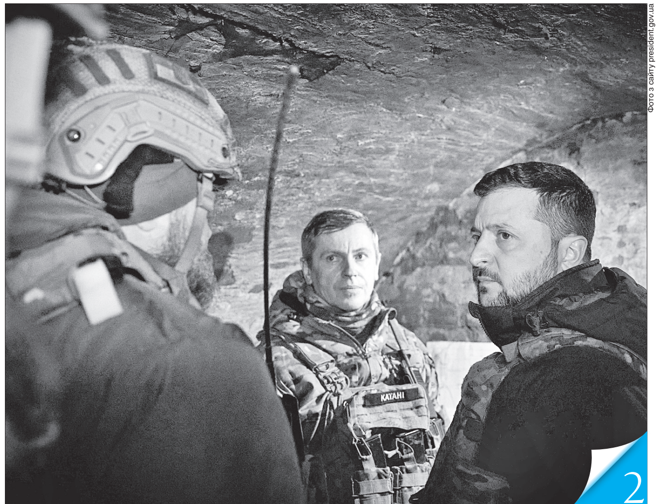
Володимир Зеленський поспілкувався із захисниками та вручив їм державні нагороди

РОБОЧА ПОЇЗДКА. Президент України відвідав передові позиції українських військових