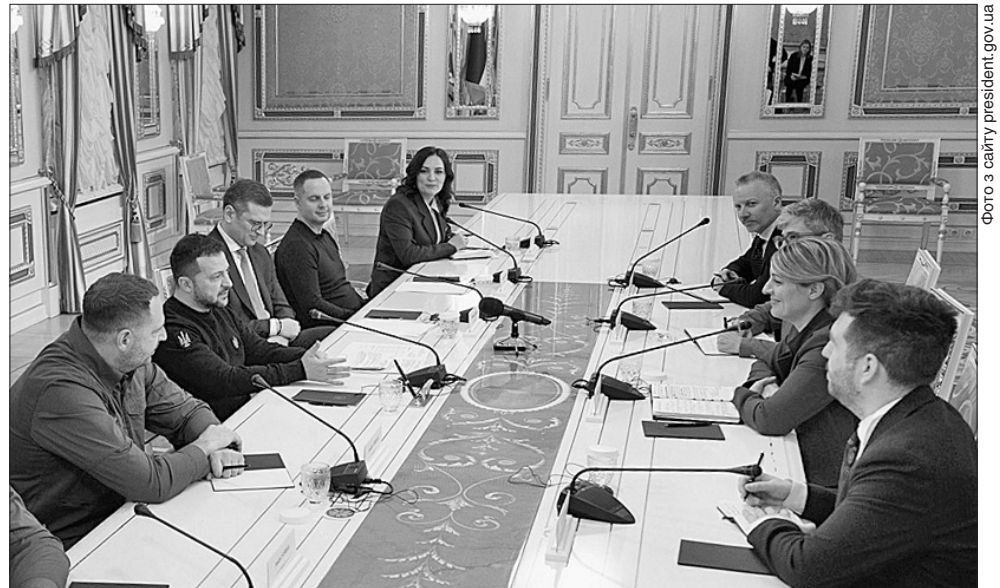
За словами Володимира Зеленського, участь Мелані Жолі в засіданні Міжнародної коаліції в Києві засвідчує істотну роль Канади в процесі повернення українських дітей

«Для нас повернення всіх українських громадян, включно з дітьми, залишається одним із ключових пріоритетів. Ми вдячні Канаді за вагомий внесок у створен-