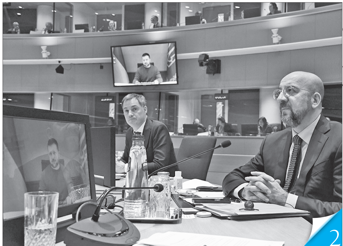
Володимир Зеленський, виступаючи онлайн на спеціальному засіданні Євросоюзу, подякував європейським лідерам за одностайну позицію

ЧІТКИЙ СИГНАЛ. Лідери країн-членів Євросоюзу політично підтримали започаткування інструменту Ukraine Facility