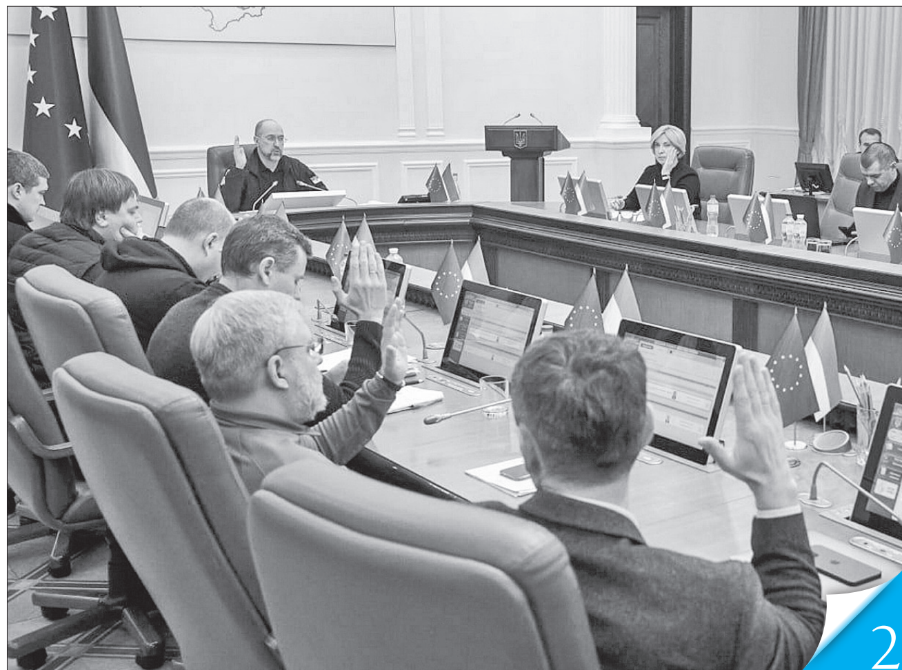
Уряд підтримує ініціативи, які роблять енергосистему менш уразливою до атак ворога

ЗАСІДАННЯ КАБІНЕТУ МІНІСТРІВ. Тариф на електроенергію для населення залишається незмінним