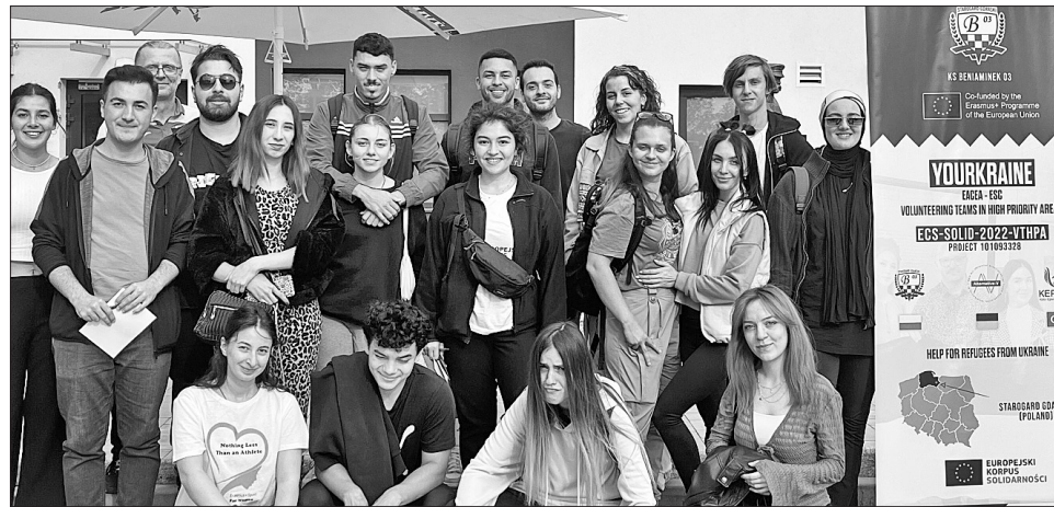
Учасники проєкту стали командою, готовою й надалі допомагати українцям

Відзначимо передовсім тих, хто його втілював. Це групи волонтерів трьох країн — України, Польщі й Туреччини. Більшість із них — фахівці з середньою спеціальною та вищою освітою, зокрема в галузях психології, фізичного виховання, екології. Вони прагнули бути уважними й чуйними до потреб українських переселенців, залучати їх до активного способу життя та спільної діяльності в новому оточенні. Цій меті слугували різноманітні заходи, зокрема спортивні