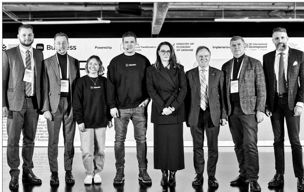
Урядовці й представники міжнародних партнерів співпрацюватимуть ще ефективніше

Стійкість українського підприємця — це те, що врятувало нашу економіку в перші дні війни. Це підприємці, які швидко змогли релокуватися і працювати далі. Про підтримку українського бізнесу 2023 року та плани на 2024-й розповіла під час заходу перший віцепрем'єр-міністр — міністр економіки Юлія Свириденко. Вона зазначила, що торік було видано понад 10 тисяч мікрогрантів на 2,4 млрд грн на започаткування чи розвиток підприємств у межах проєкту «Власна справа». Ще 109 млн на розвиток свого бізнесу отримали майже 300 ветеранів, ветеранок, їхніх друзів і чоловіків. Популярною була також програма «Доступні кредити 5—7—9%», яка стала чи не єдиним джерелом дешевих кредитів у країні.