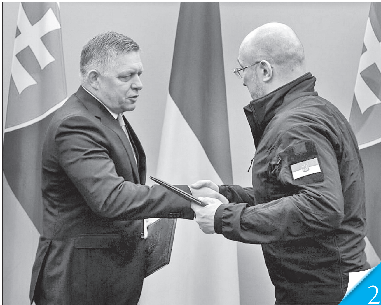
За підсумками зустрічі в Ужгороді Денис Шмигаль і Роберт Фіцо підписали спільну заяву

СУСІДСТВО. Прем'єри України і Словаччини досягли домовленостей щодо розвитку військово-технічної співпраці на комерційній основі та допомоги з гуманітарного розмінування