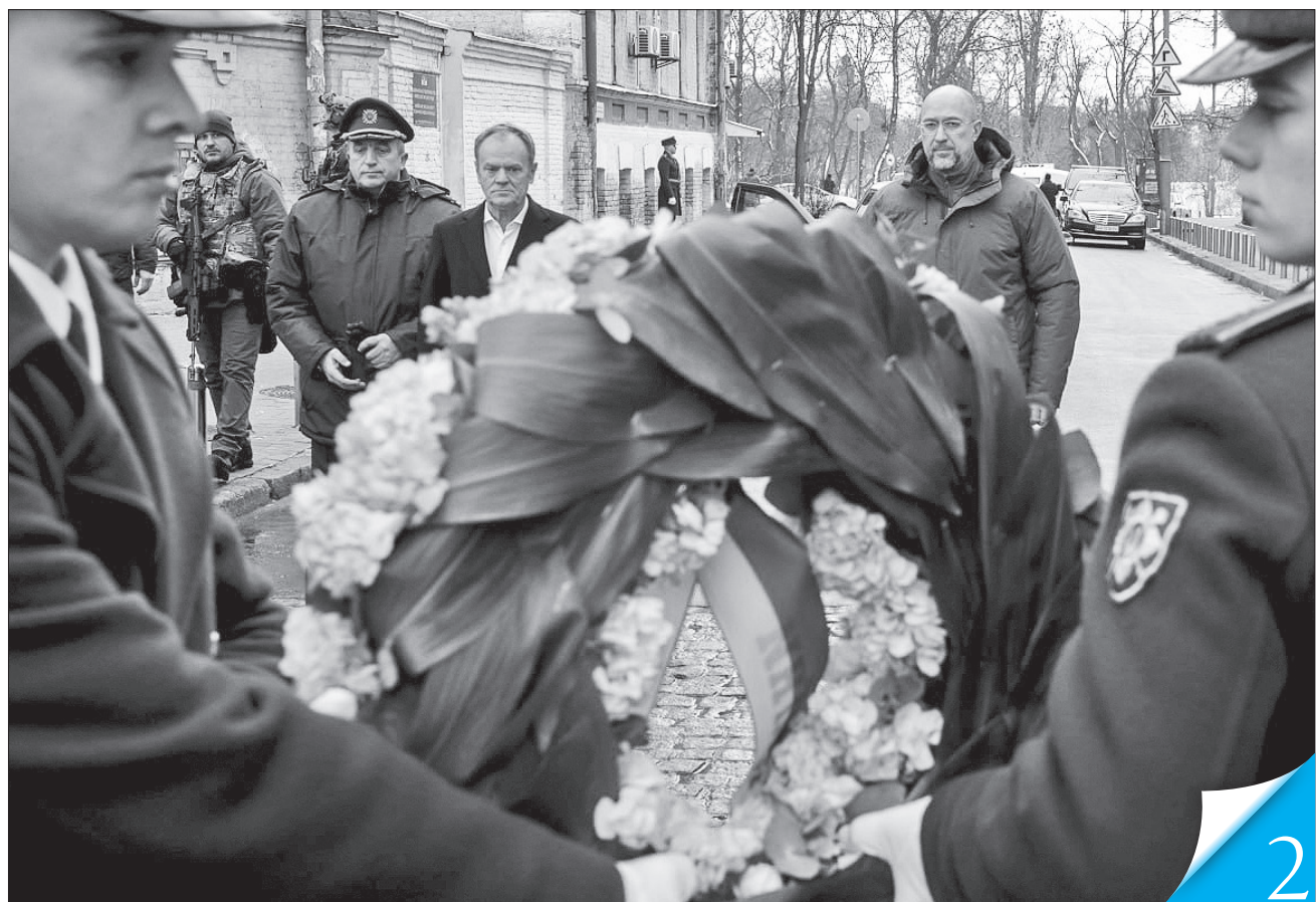
Передовсім Прем'єр-міністр Польщі Дональд Туск та Прем'єр-міністр України Денис Шмигаль вшанували полеглих у російсько-українській війні біля Стіни пам'яті на Михайлівській площі столиці

ЗНАКОВИЙ ВІЗИТ. Прем'єр-міністр Республіки Польща, перебуваючи в Києві у День Соборності, заявив, що немає нічого важливішого за підтримку України в її відсічі російській агресії