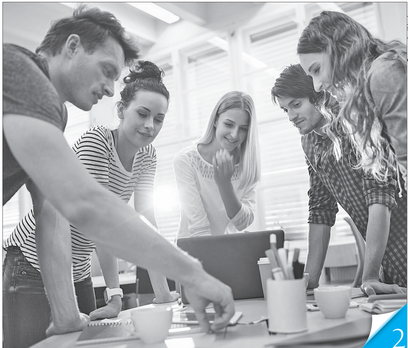
Соціальна підтримка за новими стандартами розширює можливості для особистісного розвитку

ПУБЛІЧНИЙ ЗВІТ. Міністерство соціальної політики презентувало підсумки роботи за 2023 рік