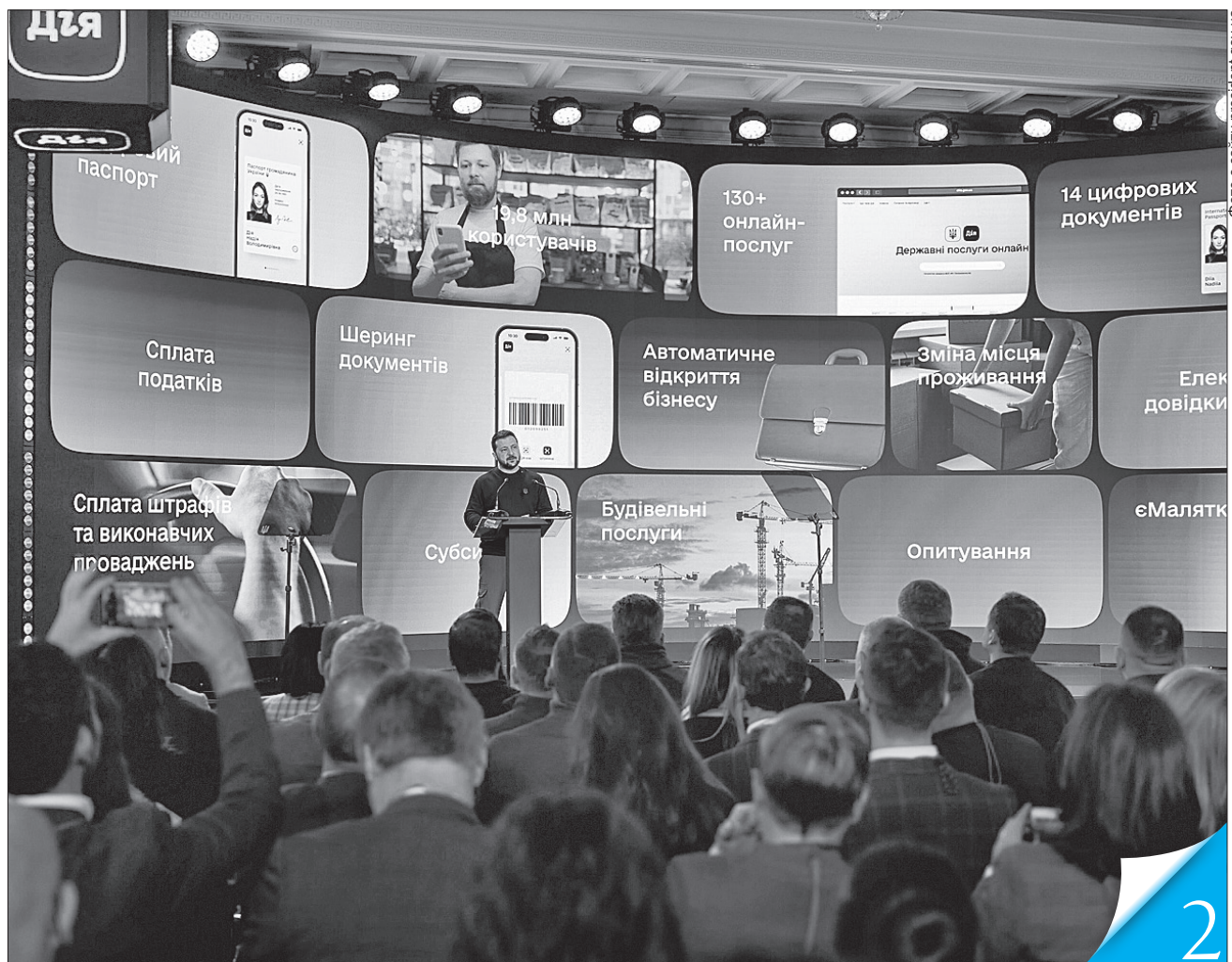
ЦИФРОВІЗАЦІЯ. Керівники держави взяли участь в одному з головних технологічних заходів року — Diia Summit 2023