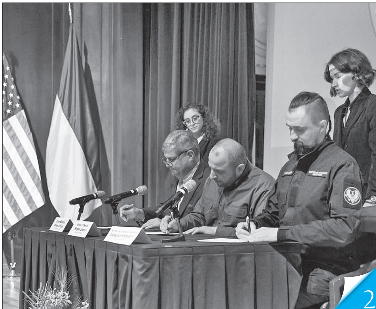
Меморандум про наміри щодо спільного виробництва та обміну технічними даними укладено між Міністерством оборони США й вітчизняними Міністерством оборони та Міністерством з питань стратегічних галузей промисловості