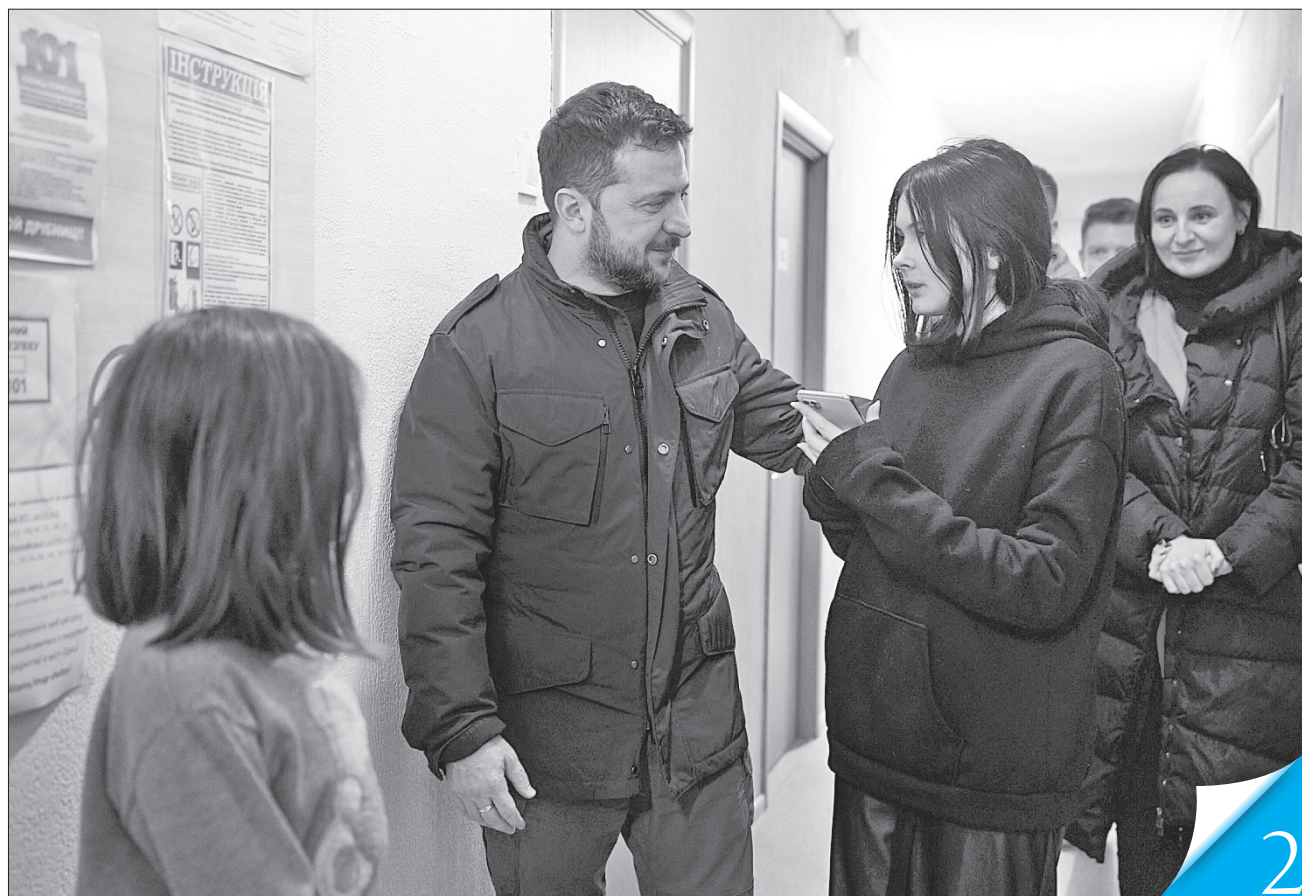
В Одесі Володимир Зеленський відвідав обласний центр соціально-психологічної допомоги, де перебувають внутрішньо переміщені особи та українці, евакуйовані із Сектору Газу

РОБОЧА ПОЇЗДКА. На Одещині Президент Володимир Зеленський провів нараду з ліквідації наслідків негоди. Він також побував у Миколаївській та Херсонській областях