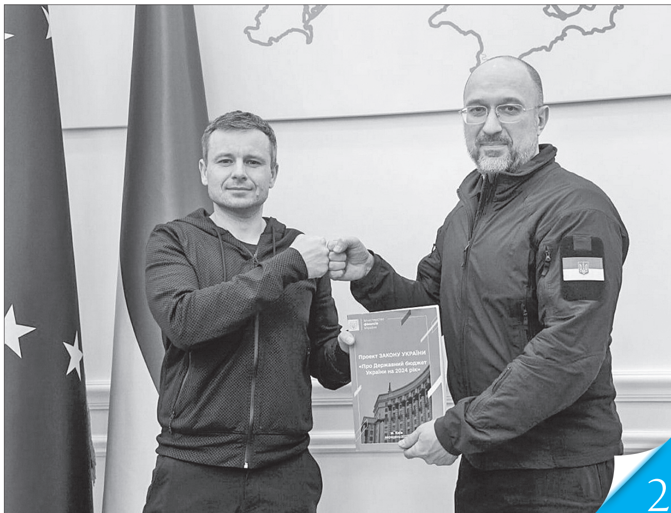
Очільник уряду Денис Шмигаль та міністр фінансів Сергій Марченко задоволені остаточною редакцією Держбюджету-2024

ЗАСІДАННЯ КАБІНЕТУ МІНІСТРІВ. Прем'єр-міністр Денис Шмигаль означив дев'ять основних моментів головного фінансового документа на наступний рік