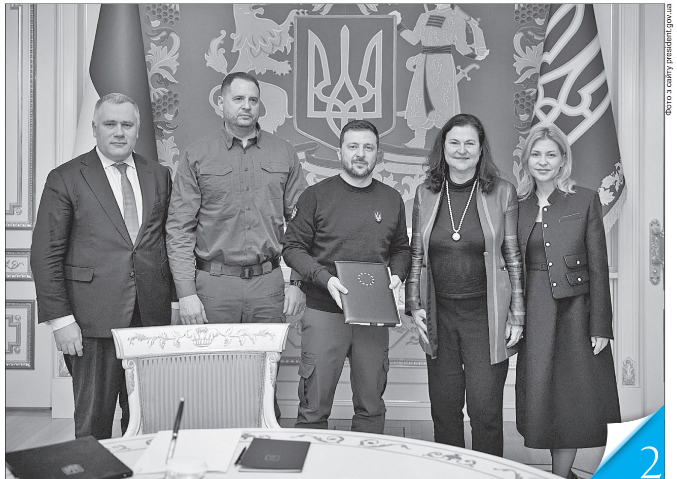
Потужною мотивацією, великим кроком уперед у європейській інтеграції назвав Володимир Зеленський рекомендацію Єврокомісії почати переговори про вступ України до ЄС

ПОСТУП. Голова Представництва Європейського Союзу Катаріна Матернова передала звіт щодо України керівникам держави