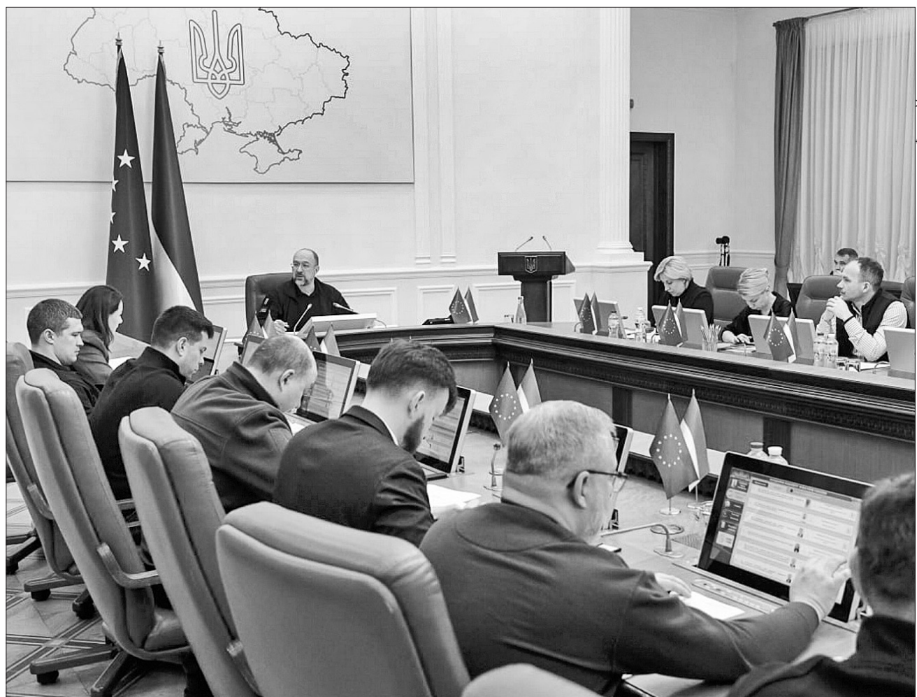
Прем'єр наголосив, що кошти українських платників податків уряд і надалі спрямовуватиме виключно на забезпечення Сил безпеки та оборони

ЗАСІДАННЯ КАБІНЕТУ МІНІСТРІВ. Попри внесення певних корекцій пріоритет залишився незмінним — оборона і перемога України