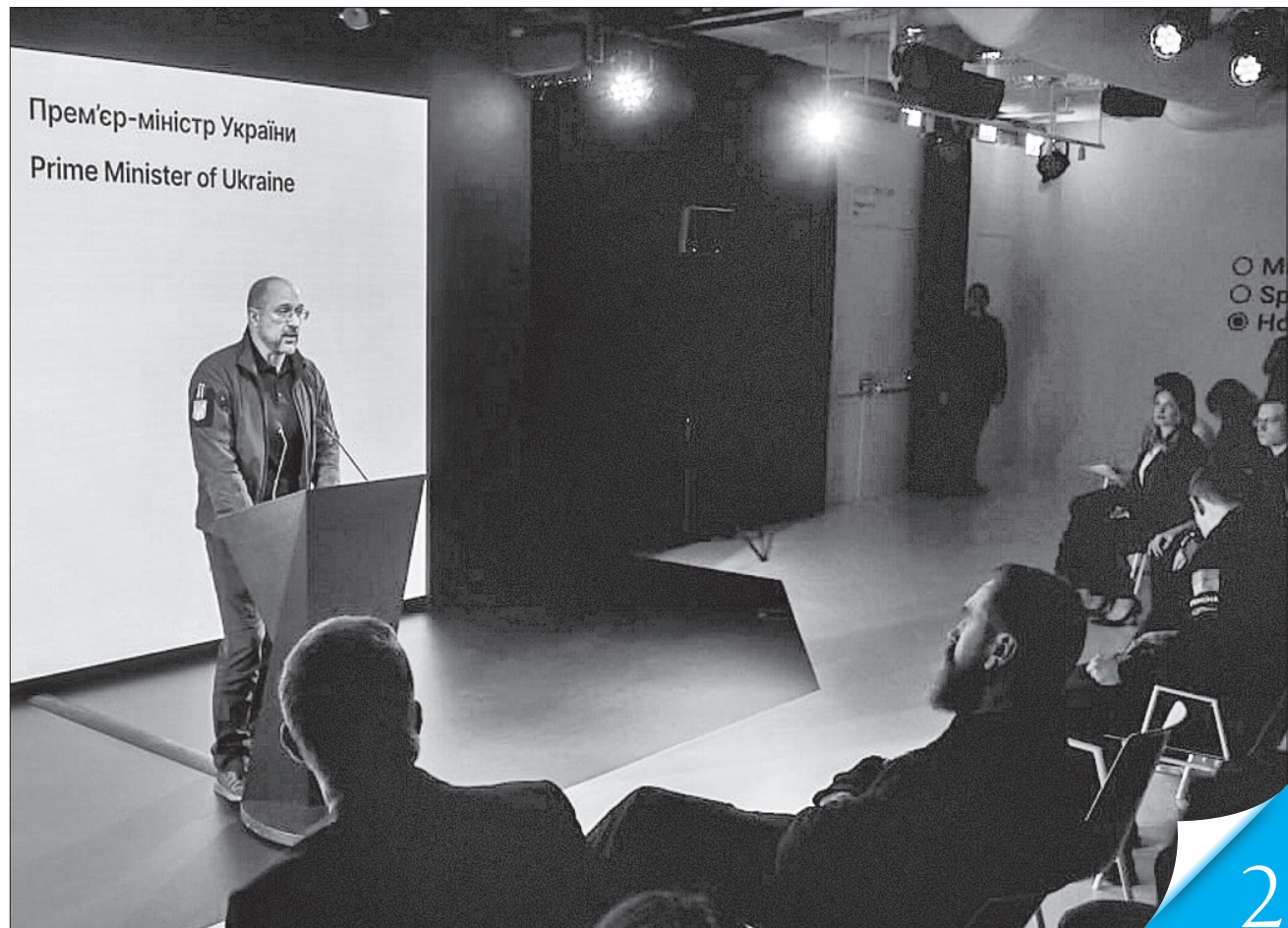
Прем'єр зазначив, що інтеграція в єдиний мовний простір — запорука реалізації реформ та процесу вступу України в ЄС

МІЖНАРОДНЕ СПІЛКУВАННЯ. В Україні стартує національний проєкт з популяризації англійської мови