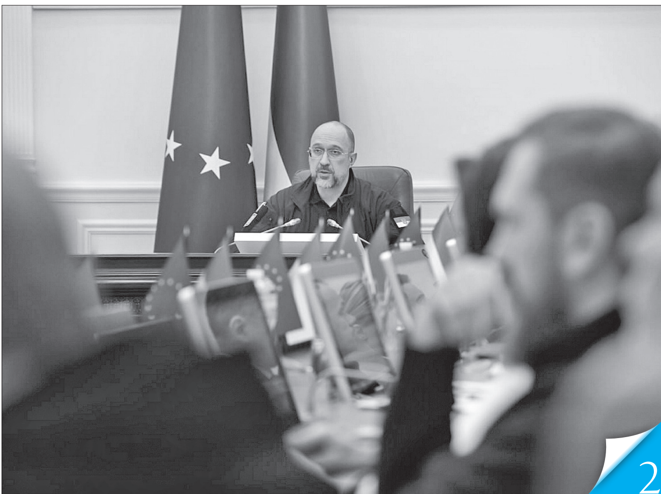
Прем'єр подякував міжнародним партнерам за підтримку

ЗАСІДАННЯ КАБІНЕТУ МІНІСТРІВ. Будівельна галузь має стати однією із провідних у повоєнні роки, щоб компенсувати втрати в житловому фонді, яких завдав ворог