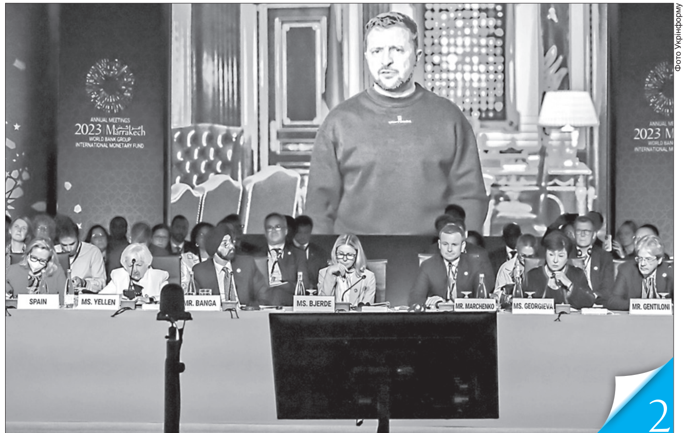
На четвертому засіданні міністерського круглого столу щодо підтримки України в Марракеші виступив Президент України Володимир Зеленський

ФІНАНСИ. Річні збори МВФ і Світового банку, які відбулися в Марокко, підтвердили готовність міжнародних фінансових інституцій і надалі підтримувати нашу країну