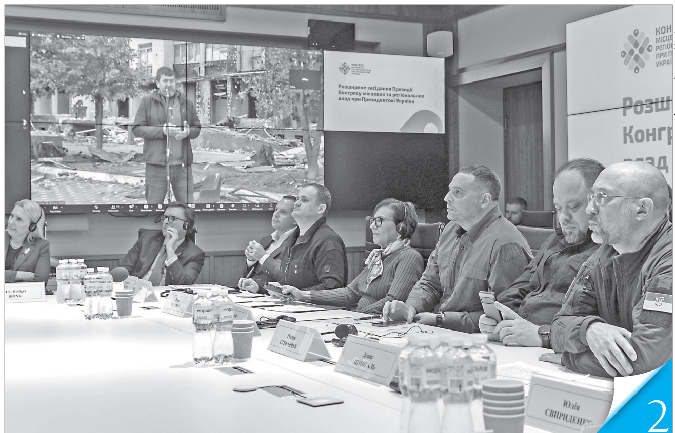
Під час онлайн-включення представники громад Київщини інформували президію Конгресу місцевих та регіональних влад при Президентіві України про проблеми, пов'язані з процесом відбудови

ВІЗИТ. У Києві зі спецпредставником США зустрілися керівники держави, про проблеми відбудови Київщини Пенні Пріцкер дізналася на засіданні президії Конгресу місцевих та регіональних влад