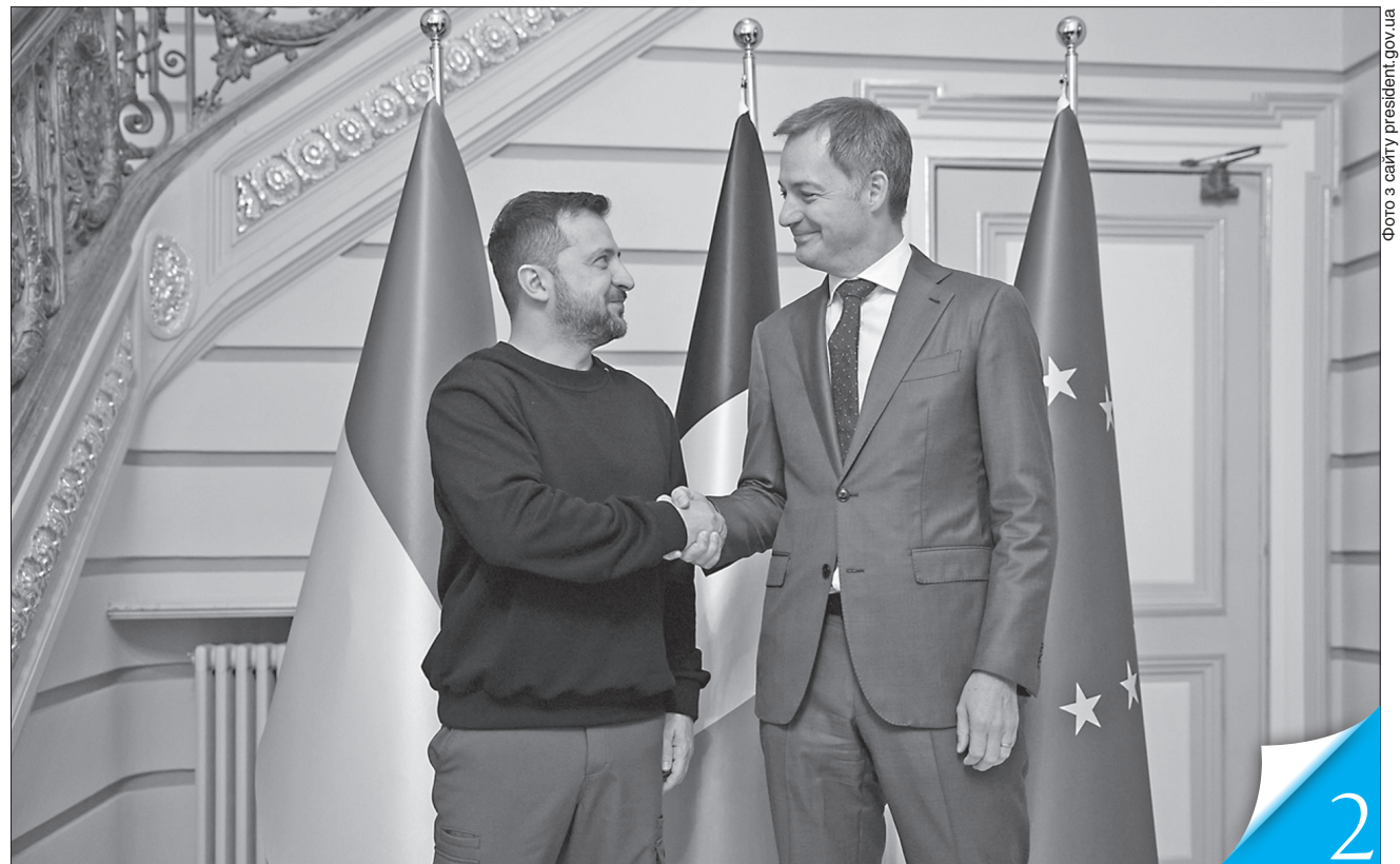
Прем'єр Бельгії Александер Де Кроо повідомив Володимира Зеленського, що його країна першою використає заморожені російські активи на підтримку України

РОБОЧИЙ ВІЗИТ. У межах перебування у Брюсселі для участі в засіданнях групи «Рамштайн» та Ради Україна — НАТО Президент Володимир Зеленський провів двосторонні зустрічі