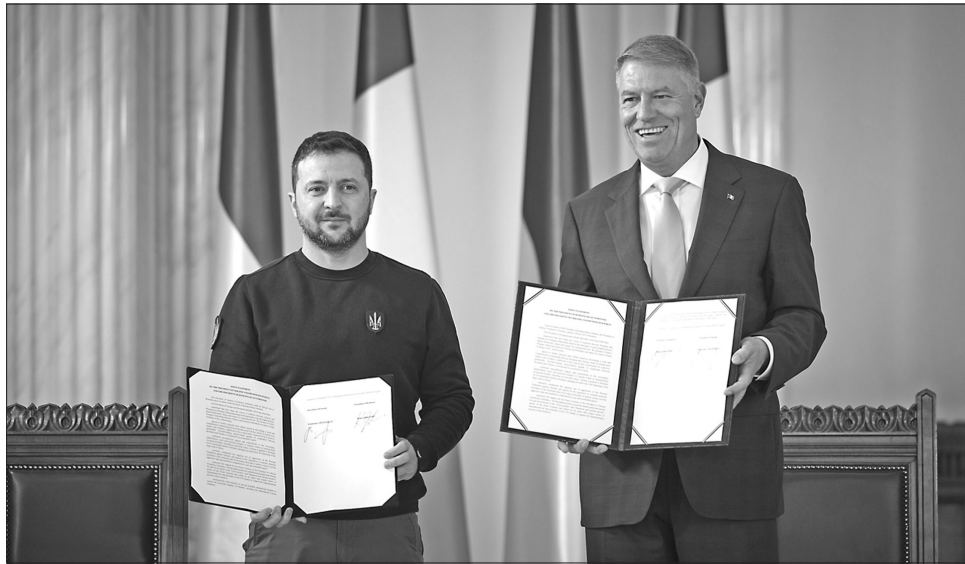
Президент України Володимир Зеленський і Президент Румунії Клаус Йоганніс за результатами зустрічі в Бухаресті підписали спільну заяву

Окремо Володимир Зеленський відзначив один із стратегічних напрямів співпраці у трикутнику Україна — Румунія — Молдова: «Уже скоро запрацює зерновий коридор